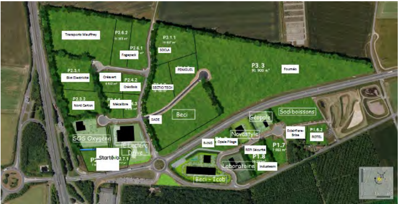
Parc d'Activités de la Porte du Littoral – Commercialisation au 12/01/2024

Au 01 janvier 2024, il reste à vendre sur la Porte du Littoral :